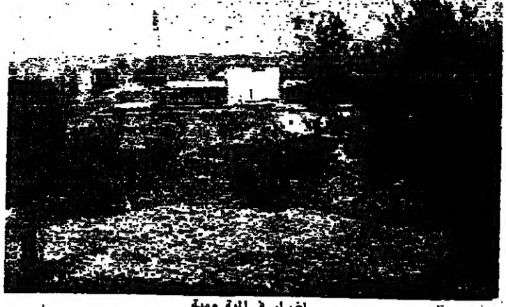
اضراب في المية ومية

رحب الأمين العام للحزب والقوى الديمقراطية في المنطقة الشرقية - الدكتور فادي زرايزر - بفتح ملف الحريات والديمقراطية وصولاً الى العمل السياسي في شكل واسع وجدي. فراح أوروبا الشرقية لا بد ان تأتي ببعض الخبرات التي وفقتنا... وقال اننا نرحب بالخلاف بسبب عدم اعترافه بتعددية لبنان والاعتراف برفض الاعتراف بوجود شعب مسيحي في لبنان مما يعني رفضه حقها الاساسية. من هنا تمسكتا بالجمهورية اللبنانية الحرة التي حلت حكومتها في ٤ تشرين الثاني المجلس النيابي. وانك ان - من هذا المنطلق - تعتبر ان رئيس الحكومة هو العباد ميشال عن حكومتها هي الشرعية بالنسبة لنا.. ولهذا لا نعترف بان هناك رئيساً اخر للدولة التي نعترف بها.